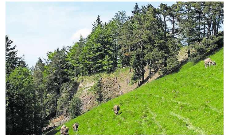
Im Rahmen des LKN wurde das Waldstück gelichtet, um dem Frauenschuh optimale Standortbedingungen zu bieten.