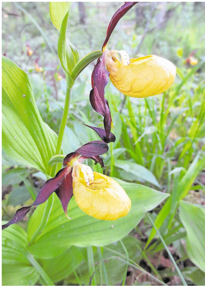
Der Frauenschuh steht in Europa auf der roten Liste bedrohter Pflanzen und darf nicht gepflückt werden.

Jetzt im Oktober ist die Blütezeit (Mitte Mai bis Mitte Juni) des Gelben Frauenschuhs zwar vorbei, dennoch sind vereinzelt verwelkte Pflanzen zu finden. «Vor dem Winter wird die oberirdische Pflanze noch ganz absterben. Gleichzeitig entwickeln sich die Knospen für die nächstjährige Blüte. Um nicht zu erfrieren, überwintern diese Knospen knapp unter der Erdoberfläche», erläutert Sandra Gerlach. Damit die Knospe ohne Tageslicht übersteht, lebt die Pflanze mit einem Pilz in Symbiose. «Ohne dessen Vorkommen wird sich ein Frauenschuh nicht ansiedeln – die Pflanze ist vollkommen von ihm abhängig.» Denn die Ernährung erfolgt über Jahre hinweg über diesen Pilz, bevor nach rund vier Jahren das erste grüne Blatt kommt. Bis die Pflanze die erste